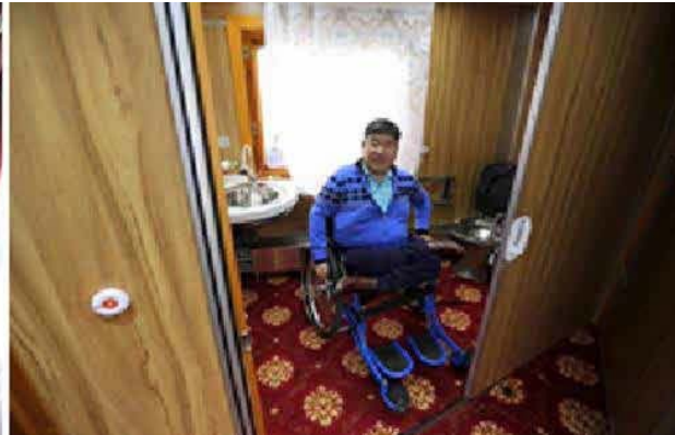
482-р вагоны дотоод тоноглол