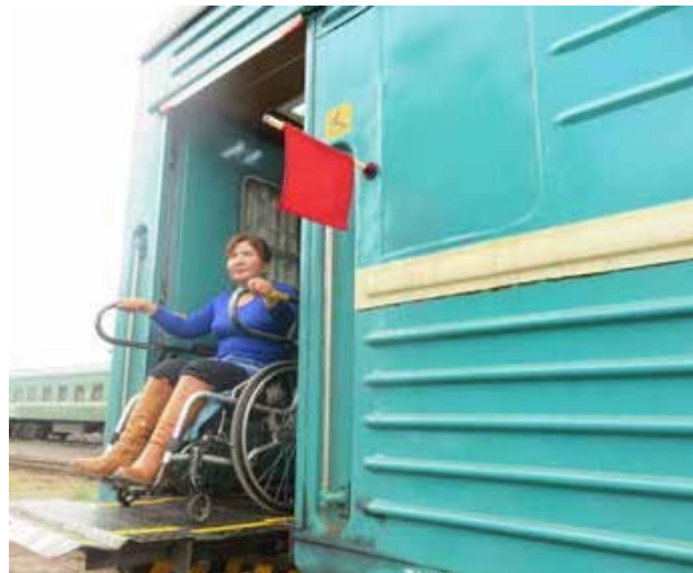
Хүртээмжтэй болгосон галт тэрэ