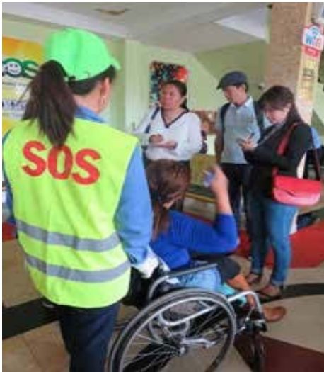
УБ төмөр замын буудал “SOS үйлчилгээ”

SOS үйлчилгээ нэвтрүүлэн хөгжлийн бэрхшээлтэй иргэдийн сэтгэл ханамжийг дээшлүүлэх, нэмэлт үйлчилгээг нэвтрүүлж, хөгжлийн бэрхшээлтэй иргэдэд үйлчлэх зам, үйлчилгээний цонхыг нээн ажиллуулж байна.