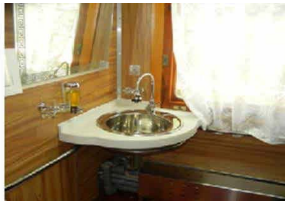
482-р вагонд хөгжлийн бэрхшээлтэй зорчигчдыг суулгах шат, ариун цэврийн өрөө