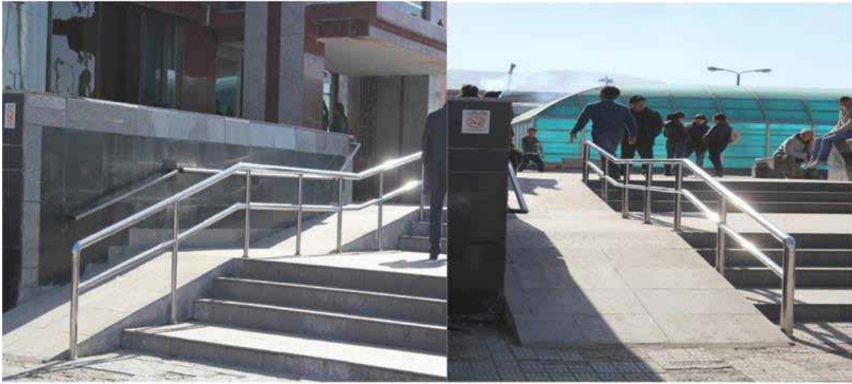
Хөгжлийн бэрхшээлтэй иргэд тэргэнцэртэй зорчих тавцан

SOS үйлчилгээ нэвтрүүлэн хөгжлийн бэрхшээлтэй иргэдийн сэтгэл ханамжийг дээшлүүлэх, нэмэлт үйлчилгээг нэвтрүүлж, хөгжлийн бэрхшээлтэй иргэдэд үйлчлэх зам, үйлчилгээний цонхыг нээн ажиллуулж байна.